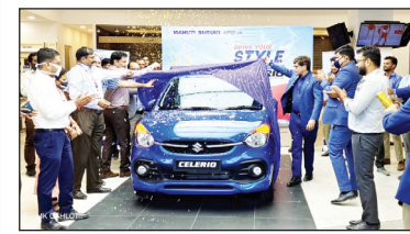
डूडी मोटर्स, बीकानेर