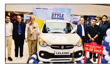
भाटिया एंड कंपनी, कोटा