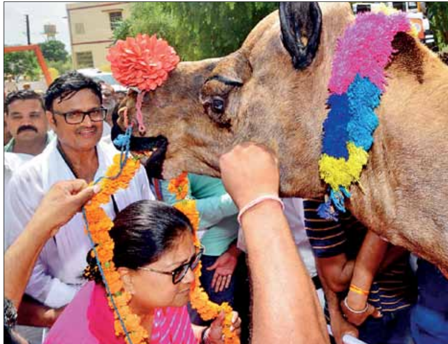
In a first, a camel offering garland to chief minister Vasundhara Raje during her yatra.

CM informed people of state govt giving jobs to family members of the martyrs of wars between 1947-1971