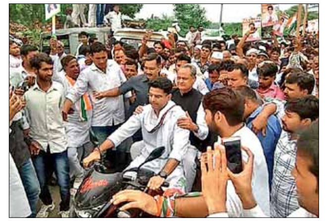
Former CM Ashok Gehlot and PCC Chief Sachin Pilot take a bike ride on Tuesday.

DNA Correspondent correspondent@dnaindia.net