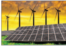
नफा नुकसान रिसर्च

जयपुर। राजस्थान में विद्युत उत्पादन की अधिष्ठापित क्षमता मार्च 2019 में 21, 077 मेगावाट से बढ़कर मार्च 2024 तक 24, 783.64 मेगावाट हो गई। लेकिन विद्युत उत्पादन की दृष्टि से देखा जाए तो प्रदेश में तापीय, जल और गैस आधारित विद्युत उत्पादन स्थिर अवस्था में है। यहाँ तक कि गैस से विद्युत उत्पादन तो गत वर्ष के आंकड़े से भी नीचे चला गया। केवल सौर, पवन ऊर्जा ही राज्य में विद्युत उत्पादन को गति दे रहे हैं, वह भी निजी क्षेत्र की परियोजनाओं के सहारे।